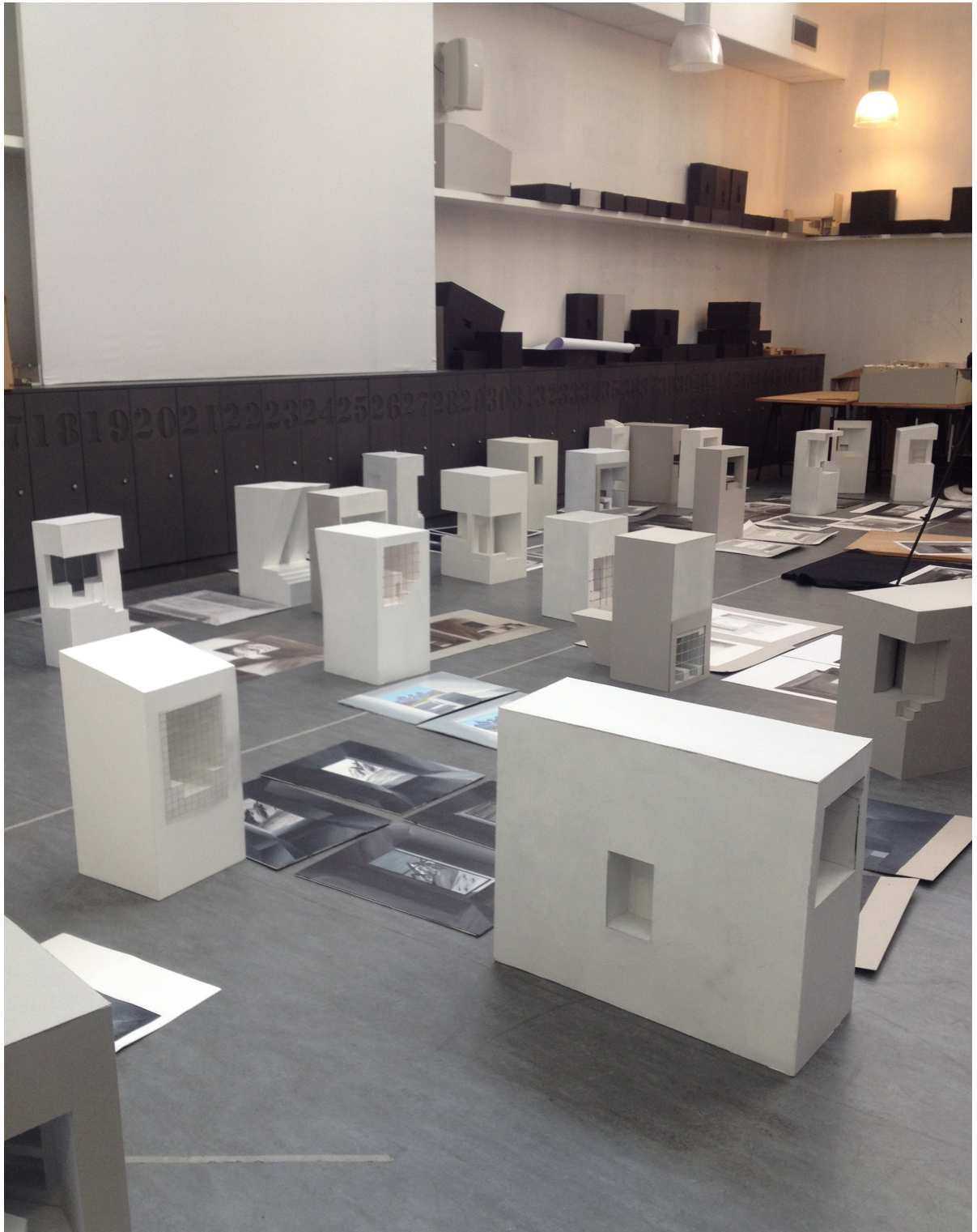
Atelier d'architecture en Semestre 1