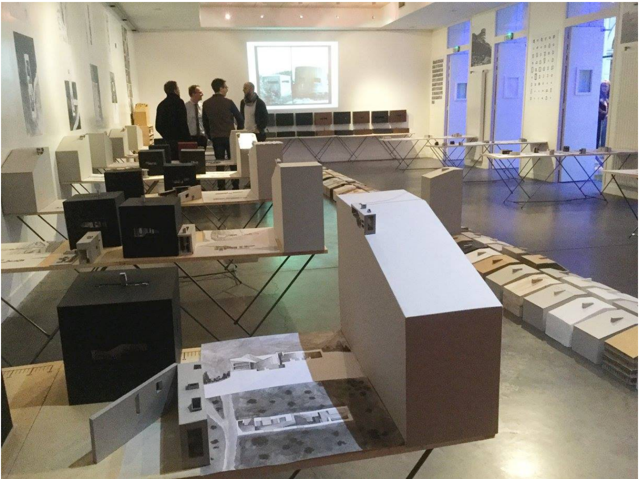
Le Monolithe habité : la forme intérieure - Travaux des étudiants de Semestre 1 /

Enseignants responsables : Evelyne Chalaye - Pierre-Albert Perrillat