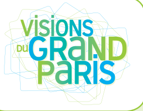
TABLE RONDE PLÉNIÈRE - AUDITORIUM - 16 H à 18 H